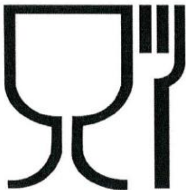
Рис.1. Упаковка (укупорочные средства), предназначенная для контакта с пищевой продукцией

Символы, наносимые на маркировку упаковки (укупорочных средств)